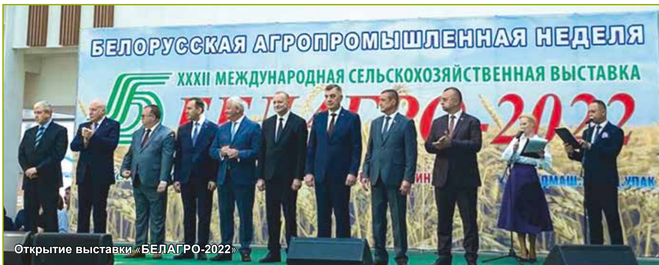
Открытие выставки «БЕЛАГРО-2022»