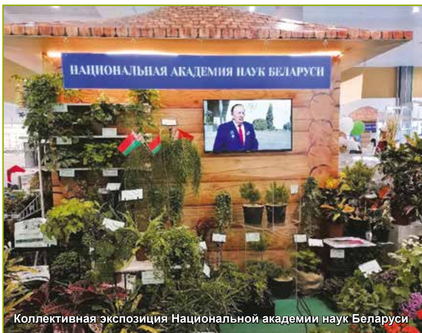
Коллективная экспозиция Национальной академии наук Беларуси

В приветственном слове Вице-премьер Заяц Леонид Константинович отметил, что на выставку приехало большое количество гостей: «Приятно отметить, что расстояние не помеха. Приехали делегации из Владивостока, Сахалинской и Мурманской областей. Искренне приветствую делегации из Монголии, Венесуэлы, Таджикистана, Ирака, Ирана и других стран. Мы обязаны кооперироваться, интегрироваться, чтобы сделать наши страны еще сильнее, а народы богаче. Эта выставка, уверен, придаст инновационный импульс развитию АПК Беларуси, России и тех стран, которые в ней участвуют».